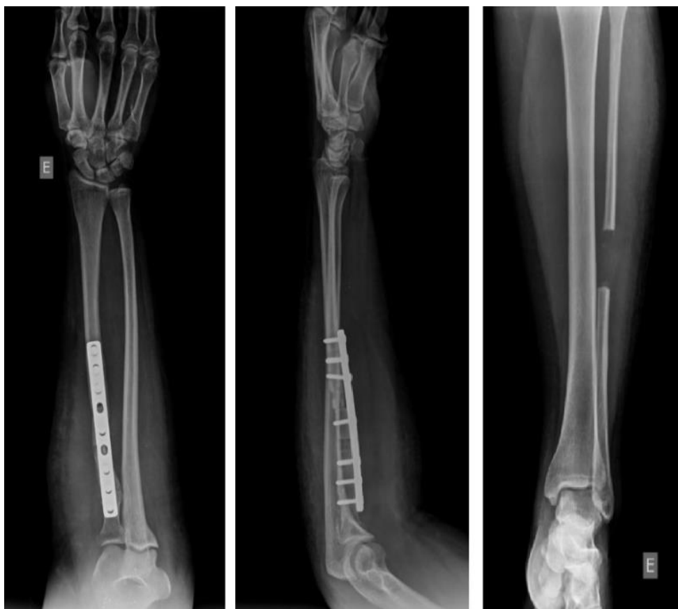
Figura 4 - Radiografias AP e de perfil do antebraço no pós-operatório imediato do tratamento cirúrgico da pseudoartrose do rádio diafisário com uso do EFNV. Na imagem à direita é possível evidenciar o tamanho do enxerto retirado da fíbula esquerda.