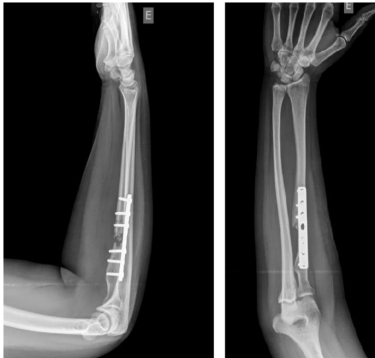
Figura 3 - Radiografias de perfil e AP do antebraço com quatro meses de evolução, evidenciando absorção óssea no foco de fratura (pseudoartrose).